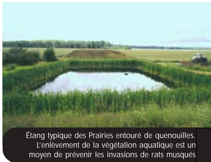
Étang typique des Prairies entouré de quenouilles. L'enlèvement de la végétation aquatique est un moyen de prévenir les invasions de rats musqués

On peut empêcher le rat musqué d'entrer ou de s'installer dans un étang en en faisant un endroit peu invitant. L'enlèvement des sources de nourriture est un bon début. Enlevez autant de plantes aquatiques à racines que possible et compostez-les à au moins 180 m de l'étang. Ensemencez le bord de l'étang d'herbe courte ou coupez la végétation à une hauteur maximale de 10 cm.