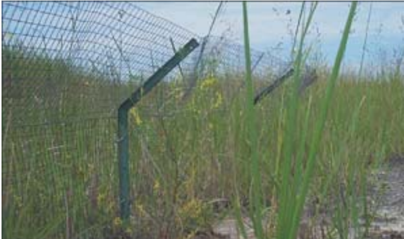
Clôture de broche servant à fermer l'accès des rats musqués à un marais